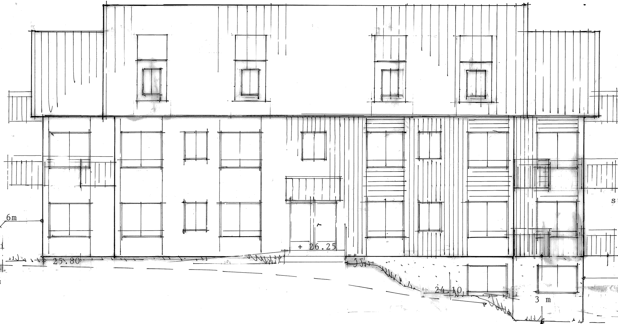
fasad mot väster (gård)

REVIDERAD 2012-09-25 REVIDERAD 2011-12-28 REVIDERAD 2011-08-15 Reviderad 2011-05-23