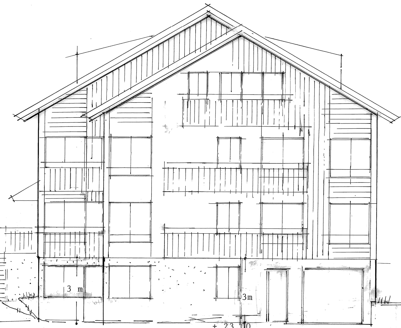
fasad mot söder